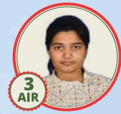
3 AIR Uma Harathi N